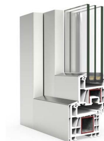
Alcover a testa